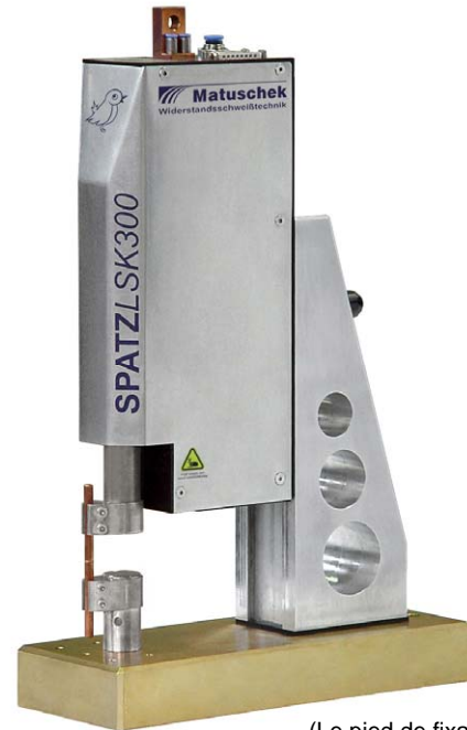
(Le pied de fixation n'est pas compris dans la livraison)

Il est possible d'arrêter le courant de soudure en fonction d'une position donnée des électrodes. Le contrôle de déplacement permet de s'assurer de la position des électrodes.