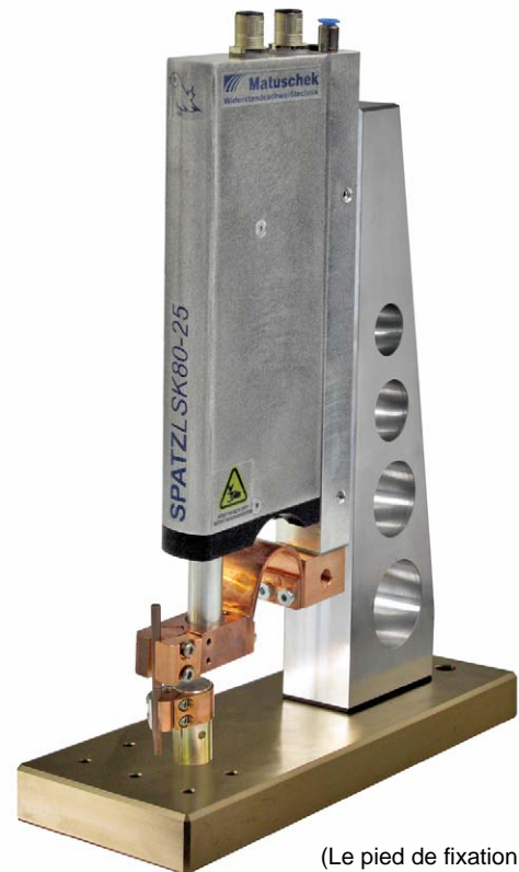
(Le pied de fixation n'est pas compris dans la livraison)

Il est possible d'arrêter le courant de soudure en fonction d'une position donnée des électrodes. Le contrôle de déplacement permet de s'assurer de la position des électrodes.